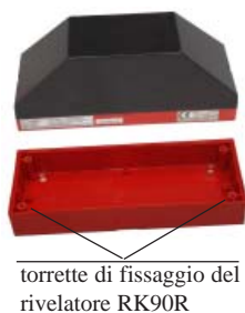
torrette di fissaggio del rivelatore RK90R

ZC-01 - E' disponibile come elemento opzionale lo zoccolo ZC-01 che facilita l'installazione nel caso in cui il cavo di collegamento viaggia entro tubo guida all'esterno della parete. Lo zoccolo ZC-01 è provvisto di fori sfondabili sui lati.